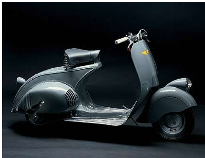
Immagine del prototipo MP6

Il prezzo di 90.000 lire , che oggi fa sorridere, equivaleva a diversi mesi di lavoro di un impiegato. Nonostante ciò, la possibilità del pagamento rateizzato fu uno stimolo notevole per le vendite: la Vespa è stato il primo impulso alla motorizzazione di massa in Italia, prima ancora dell’avvento dell’altra grande protagonista, la Fiat 500. Oggi la Vespa è un oggetto di culto , un oggetto da collezione , simbolo della “Dolce Vita” e una parte importante del costume italiano , un po’ come gli spaghetti ! In più per i nostalgici dei ricordi come noi rievoca sempre qualcosa di passato e indimenticabile e riporta la mente a cose della nostra vita che quel rombo e quell’ odore di miscela ci ha stampato bene nella memoria”. (3)