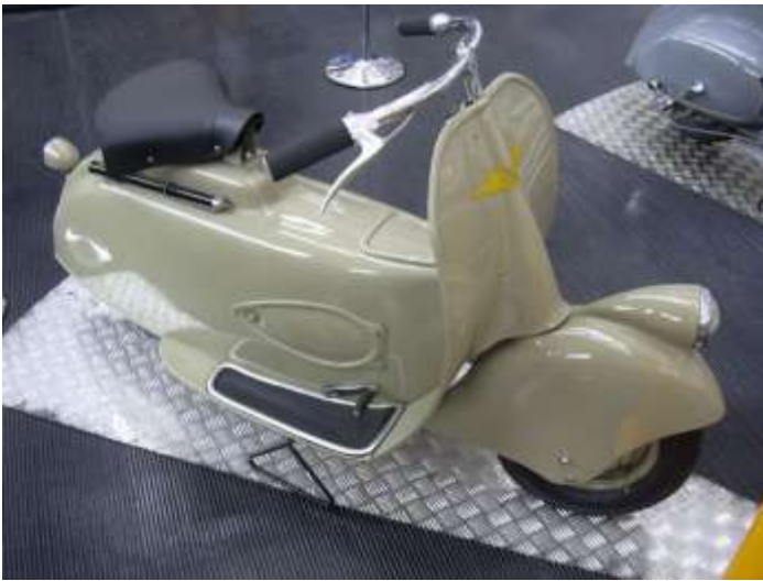
MP5 fotografata al Museo Piaggio

Nel giro di qualche mese fu approntato il prototipo ed una piccola preserie di questi scooter.”.(1)