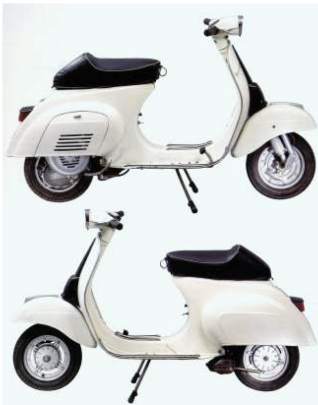
Biancospino MaxMayer 1.298.1715

“VESPA 50 Special – V5A2T/V5B1T/V5B3T (1969-1983) Numero di esemplari prodotti: V5A2T: 95.012, V5B1T: 94.670, V5B3T: 563.955