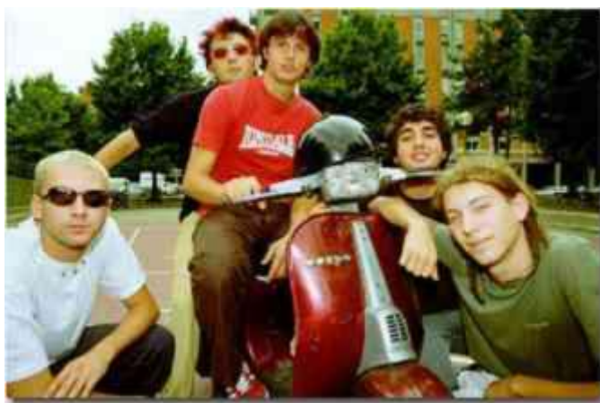
La Vespa 50 Special con il gruppo LUNAPOP

Dal numero di telaio 77696 il cavalletto in tubo da 16 mm di diametro diventa da 20 mm. Nel 1972 la Special viene equipaggiata con pneumatici 3,00 e cerchi da 10” con tamburi auto ventilanti ed anello riportato in ghisa, come sulla Primavera. Copri sterzo e tegolo sopra il fanale posteriore sono di colore grigio. La sigla di telaio diventa V5B1T mentre la sigla del motore rimane invariata ( V5A2M ).