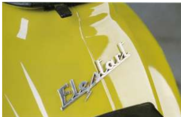
Foto tratte dal Volume 3 di Vespa Tecnica di Leardi, Frisinghelli, Notari . Edizioni CLD