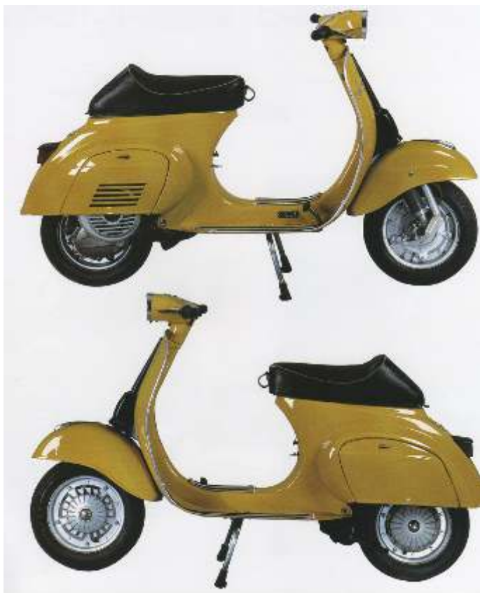
Giallo Cromo MaxMayer 1.298.2933

“VESPA 50 Elestart – V5A3T/V5B2T/V5B4T (1969-1975) Numero di esemplari prodotti: V5A3T: 4.707, V5B2T: 2.666, V5B4T: 432