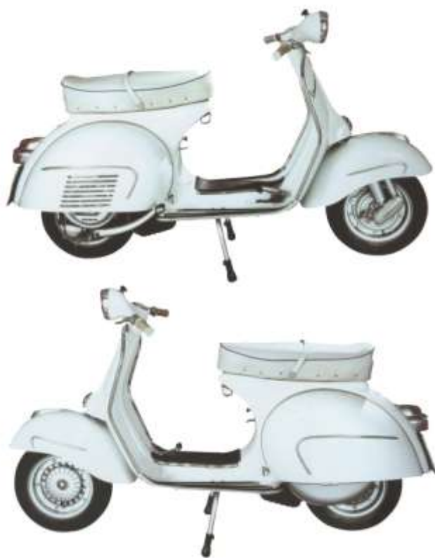
Grigio Bianca MaxMayer 1.298.8714

“VESPA 150 G.S. – VSB1T 1962/1964 Numero di esemplari prodotti: 60.000