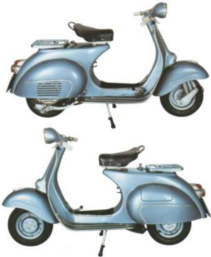
Azzurro metallizzato MaxMayer 12680890

“VESPA 150 – 1960-67 Numero di esemplari prodotti VBB1T: 145.000 ; VBB2T 134.147