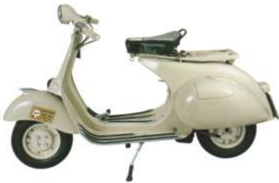
Grigio MaxMayer 15048