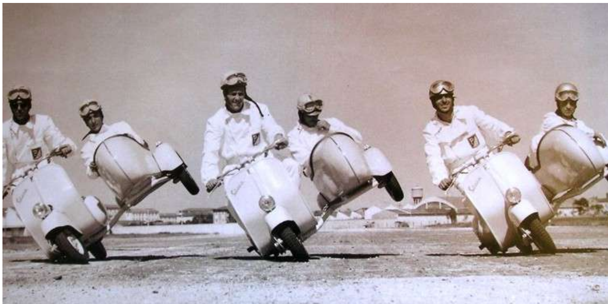
Collaudatori Vespa in azione con il sidecar