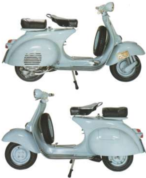
Celeste Chiaro MaxMayer 1.298.8840

“VESPA 125 – VNB1T / VNB2T (1959/1961) - Numero di esemplari prodotti VNB1T: 88.849 VNB2T: 33.698”